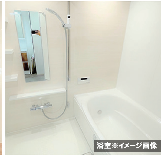
浴室※イメージ画像