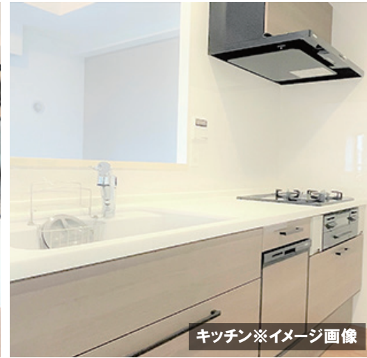
キッチン※イメージ画像