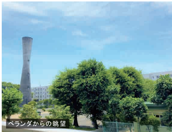
ベランダからの眺望