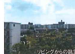
リビングからの眺望